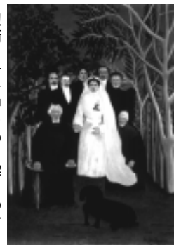
婚礼、アンリ・ルソー 1904-05年頃 La Noce, Henri Rousseau