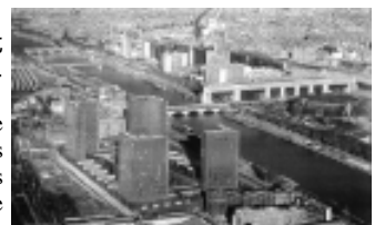
Bibliothèque nationale de France. Photo: Georges Fessy