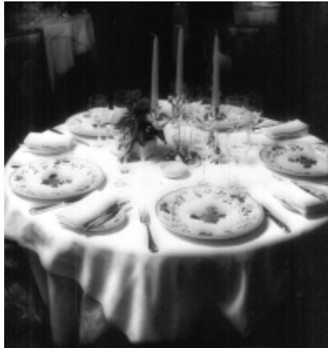
Porcelaine de Limoges, Reynaud

L'après-Révolution, c'est la grande période où la bourgeoisie s'installe au pouvoir en France. Après la Révolution française, la bourgeoisie cherche à légitimer sa position. Il y a cette volonté de manger comme les aristocrates, mais il y a en même temps l'affirmation des droits de l'Homme, l'affirmation de l'égalité. Le mythe de l'égalité va prendre forme à l'intérieur dans la façon de servir les plats: désormais tout le monde va manger de la même chose et tout le monde va avoir la même quantité. Fin 19ème, les grands hôtels se mettent en place. Le savoir-faire exceptionnel des cuisiniers va servir lorsqu'on va monter des palaces. Mais la position du cuisinier n'est encore qu'équivalente à celle d'un musicien qui n'aurait le droit de jouer que les œuvres des grands maîtres: un bon interprète mais surtout pas un créateur. Et puis quelque chose va se casser entre la gastronomie et