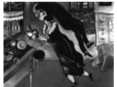
L'anniversaire 「誕生日」、油彩 1923年 ©ADAGR, Paris & SPDA, Tokyo, 1998

アンドレ・ブルトン:「現代絵画のなかに暗喩が登場したのは1911年、シャガール一人の仕業だ。」画家、版画家、イラストレーター、装飾家、マルク・シャガールは折衷主義芸術家の典型である。ギャラリー・アニメルセルでは、こけら落としを祝って1999年3月31日までシャガールの作品73点を展示、このロシア生まれのフランス人画家の幻想詩の世界へと私たちを誘ってくれる。シャガールは自分の作品にほとんど生理的な愛着を抱いており、外国旅行の際にも可能な限り何点かを携帯していた。