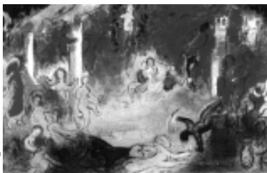
Daphnis et Chloé 「ダフニスとクロエ」 ©ADAGP, Paris & SPDA, Tokyo, 1998