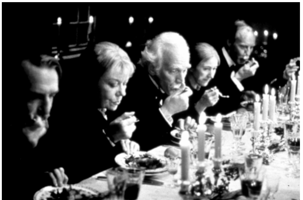
バベットの晩餐会、Le festin de Babette